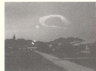
6:15 P.M., N. OF PHOENIX