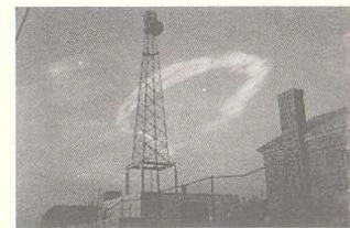
6:10 P.M., N.E. OF PRESCOTT