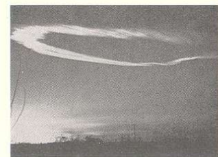
6:30 P.M., W.N.W. OF WINSLOW

... und das Rätsel eines hohen Wolkenkranzes