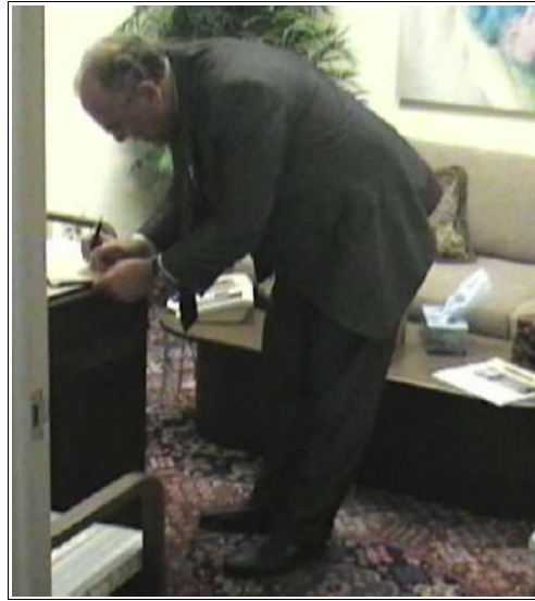
Eintragung ins Gästebuch

Die Brüder des Lateinamerikanischen Chapter´s in L.A.-Downtown „La Parrilla“, haben uns sehr herzlich empfangen und gesagt wenn wir zurück nach Deutschland kommen, sollen wir den Geschwistern sagen, dass sie daran denken, sie haben auf der anderen Seite der Welt auch eine Familie, in der sie jederzeit herzlich willkommen sind.