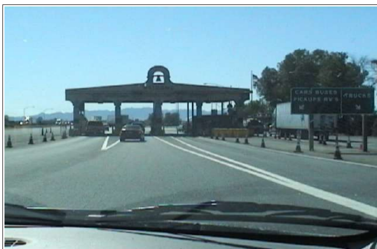
Grenztor nach Kalifornien