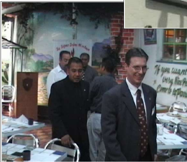
Chapter „La Parrilla“